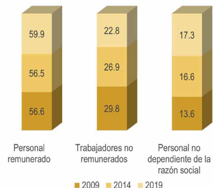
México. Distribución porcentual del Personal Ocupado según categorías.